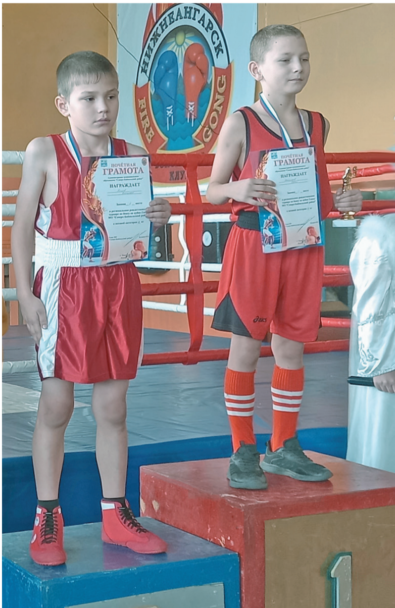
В спортивном зале «Геология» п. Нижнеангарск Северо-Байкальского района на базе ТОО «Энергия» 6 - 8 января со-

стоялся VIII Межрегиональный Рождественский турнир по боксу на призы Главы МО «Северо-Байкальский район» Игоря Валериевича Пухарева.